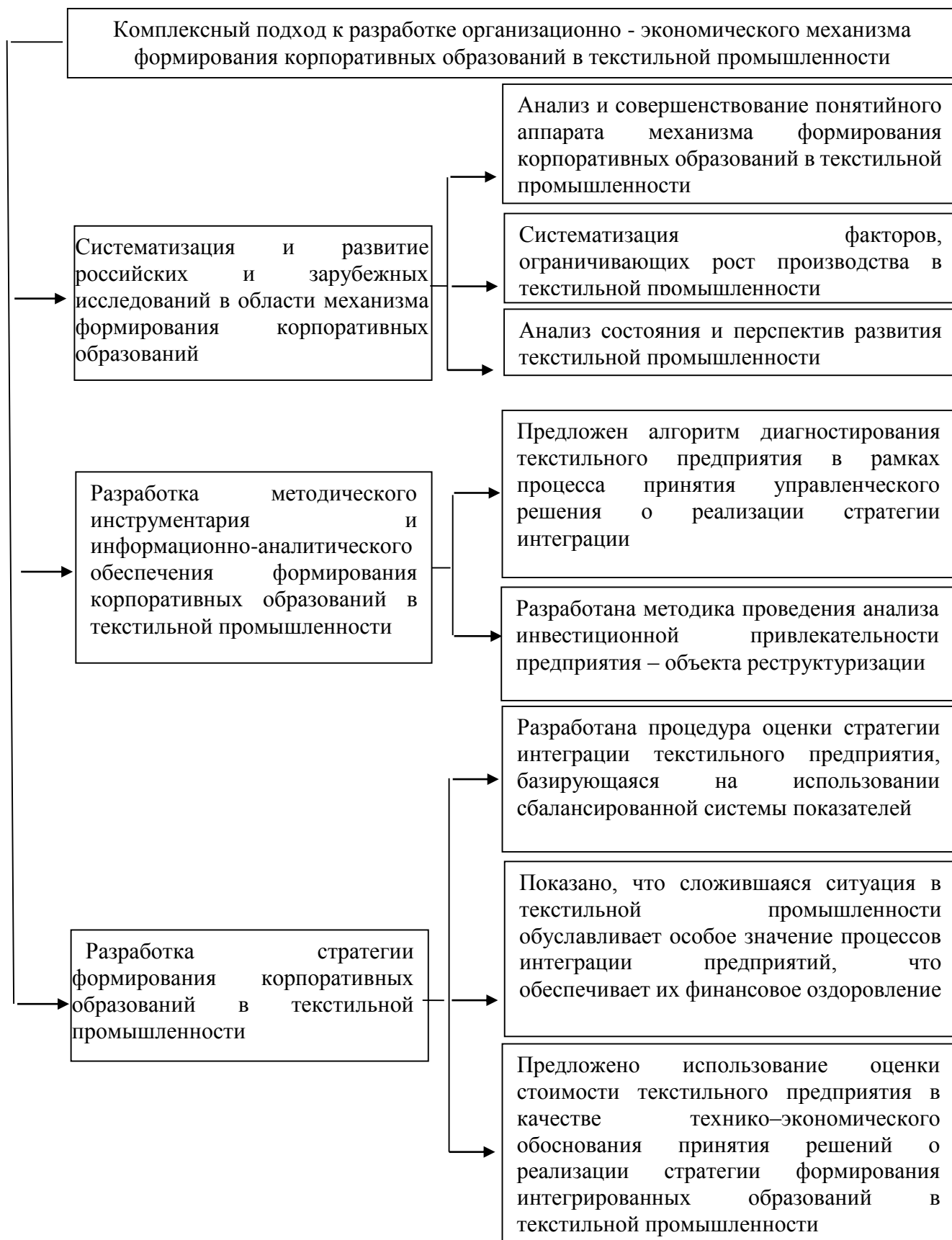
Рисунок 5 – Комплексный подход к разработке организационно – экономического механизма формирования интегрированных корпоративных образований в текстильной промышленности