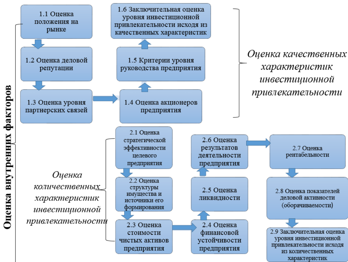
Рисунок 7 - Алгоритм оценки внутренних факторов, влияющих на инвестиционную привлекательность текстильного предприятия-объекта реструктуризации

Для оценки инвестиционной привлекательности текстильного предприятия предлагается использовать интуитивно легко воспринимаемую инвестором трехбалльную систему оценки: 3 «высокая», 2 «средняя», 1 «низкая». Для анализа ситуации в текстильной промышленности проведено анонимное анкетирование руководителей текстильных предприятий, расположенных на территории Российской Федерации. Менеджерам была предоставлена возможность определить важность каждого критерия оценки в рамках этапов проведения оценки инвестиционной привлекательности предприятия; определить значимость каждого этапа при оценке количественных и качественных характеристик; определить значимость количественной и качественной характеристик при оценке инвестиционной привлекательности предприятия.