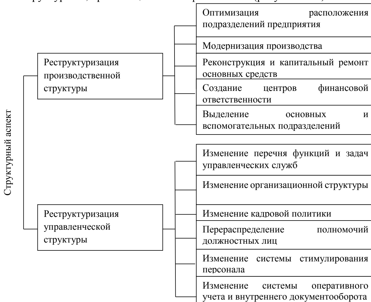
Рисунок 2 - Структурный аспект реструктуризации текстильных предприятий

«реструктуризация» связана с тем, что данное понятие представляет предмет исследования нескольких дисциплин: теории управления, теории организации и финансовых дисциплин, а значит, указанный термин затрагивает три основных аспекта: структурный; организационный и финансовый (рисунки 2 - 4).