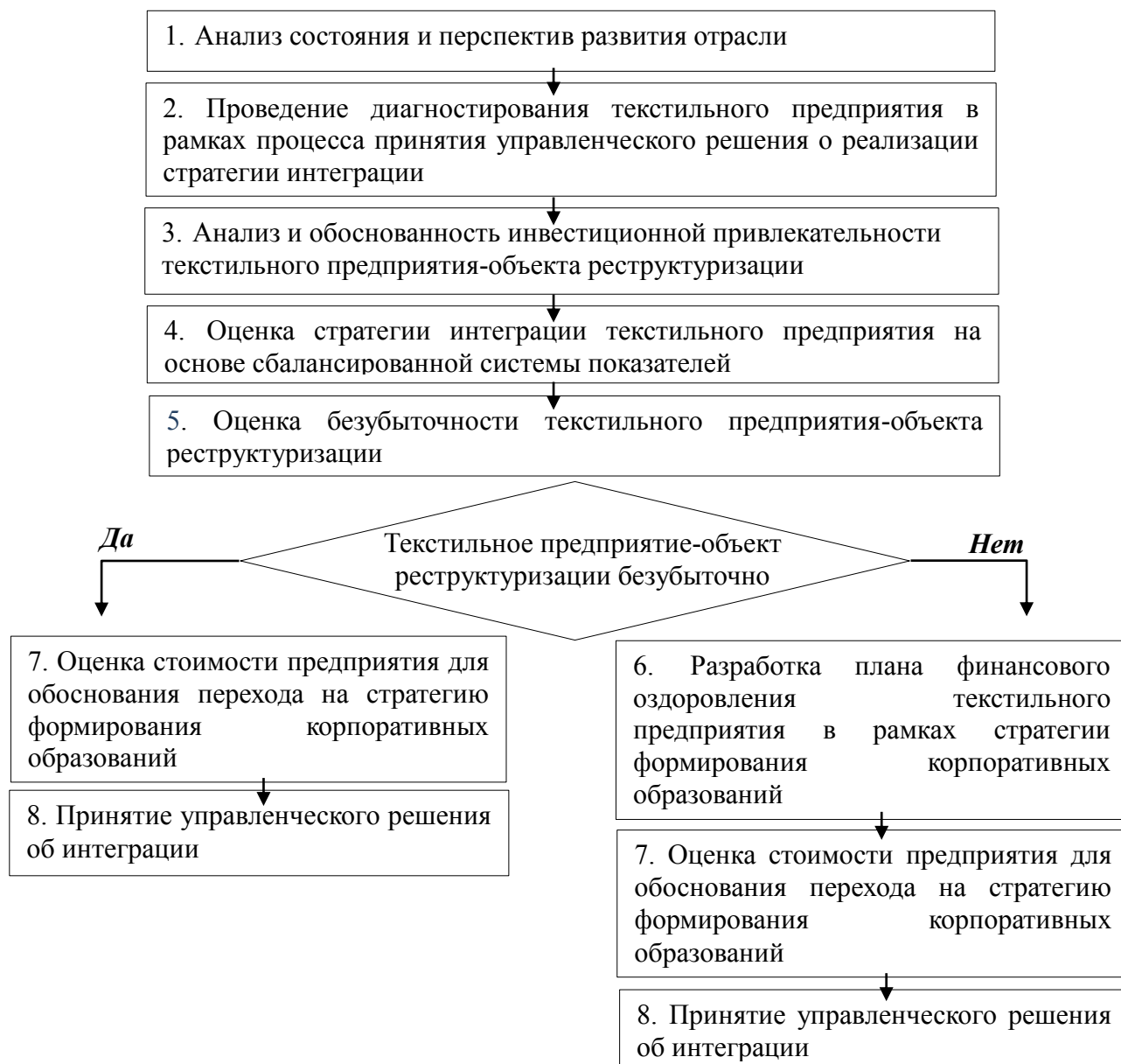
Рисунок 6 – Блок-схема организационно – экономического механизма формирования интегрированных корпоративных образований в текстильной промышленности

Выработанный механизм формирования корпоративных образований в текстильной промышленности состоит из восьми этапов (рисунок 6).