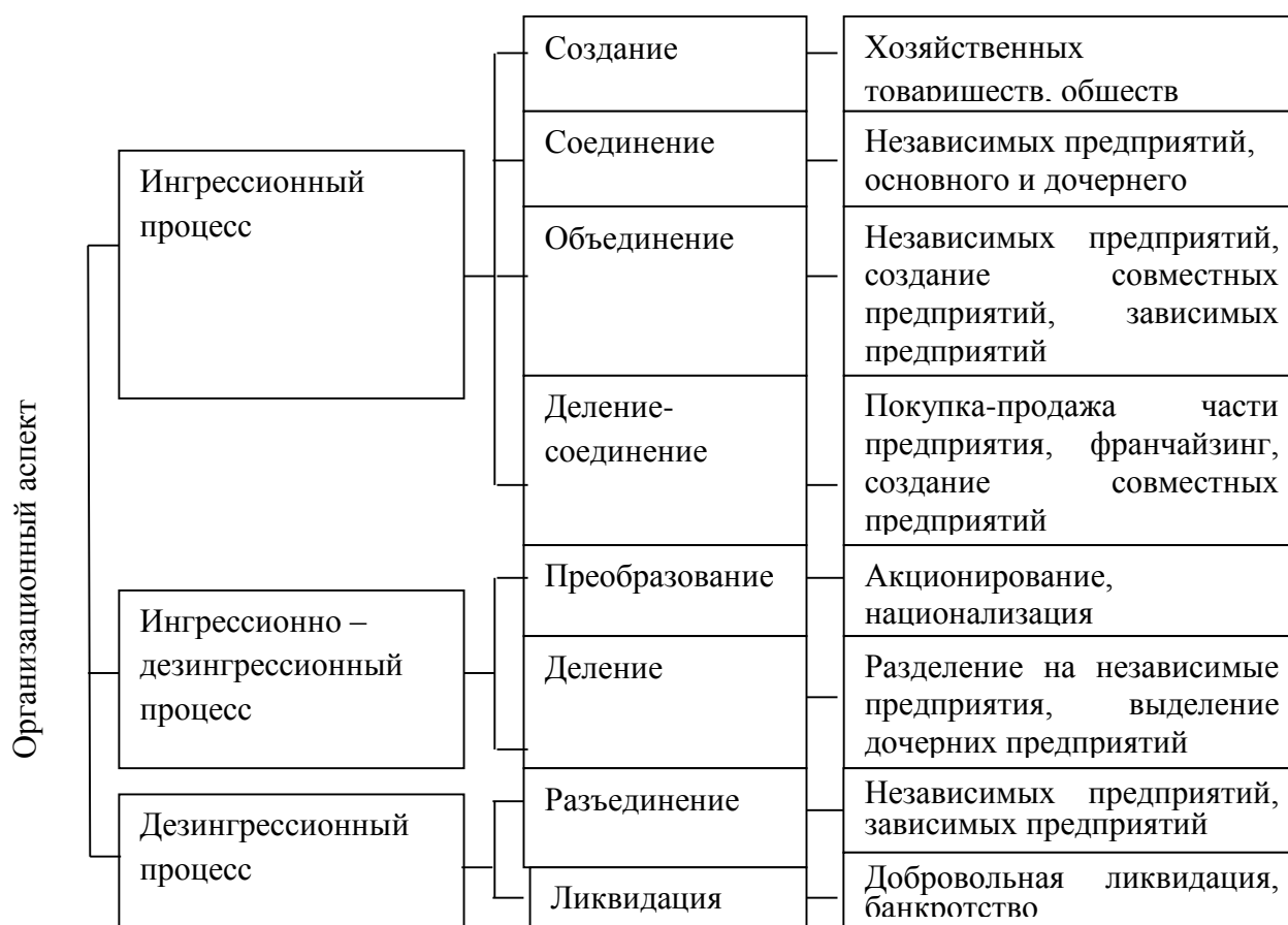
Рисунок 3 - Организационный аспект реструктуризации текстильных предприятий

полномочий должностных лиц, изменение системы стимулирования персонала, изменение системы оперативного учета и внутреннего документооборота. Организационный аспект реструктуризации текстильных предприятий целесообразно рассматривать в разрезе трех процессов: ингрессионные, ингрессионно-дезинтегрессионные, дезинтегрессионные (рисунок 3). При этом к ингрессионным процессам относятся следующие мероприятия: создание (хозяйственных обществ, товариществ, акционерных обществ), соединение (независимых предприятий, основного и дочернего предприятий), образование (независимых предприятий, создание совместных предприятий, зависимых предприятий), деление-соединение (покупка-продажа части предприятия, франчайзинг, создание совместных предприятий). Ингрессионно-дезинтегрессионные процессы включают преобразование, деление. В состав дезинтегрессионных процессов входит разделение и ликвидация.